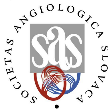
SLOVENSKÁ ANGIOLOGICKÁ SPOLOČNOSŤ o.z. SLOVENSKEJ LEKÁRSKEJ SPOLOČNOSTI (S.A.S. SLS)