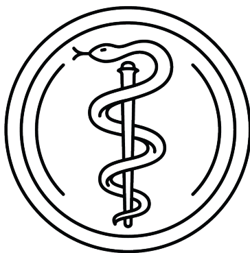
LEKÁRSKA FAKULTA UNIVERZITA KOMENSKÉHO V BRATISLAVE